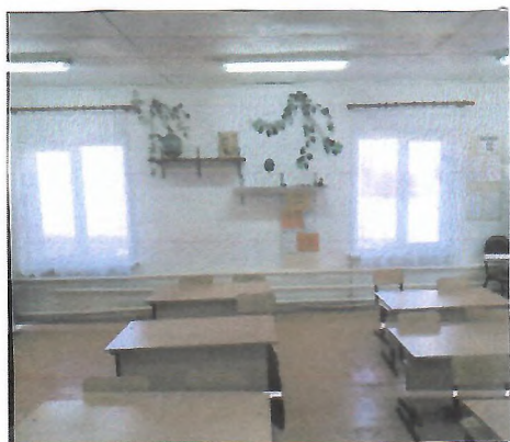
Рис 1. Фото «ДО»

7. Три графических изображения, включающих: